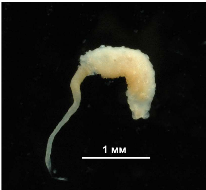
Рис. 2. Boreohydra sp.

Замечания. Единственный экземпляр (рис. 2) был обнаружен В.Г. Степановым в пробе с мелкими голотуриями. К сожалению, он несколько поврежден и точное определение не представляется возможным. В настоящее время считается, что в роде Boreohydra только один вид, B. simplex Westblad, 1937, известный по европейским и атлантическим сборам. Сопоставить тихоокеанский экземпляр с европейским видом без подробного морфологического анализа нам представляется невозможным, поэтому мы предпочитаем обозначить его здесь как Boreohydra sp.