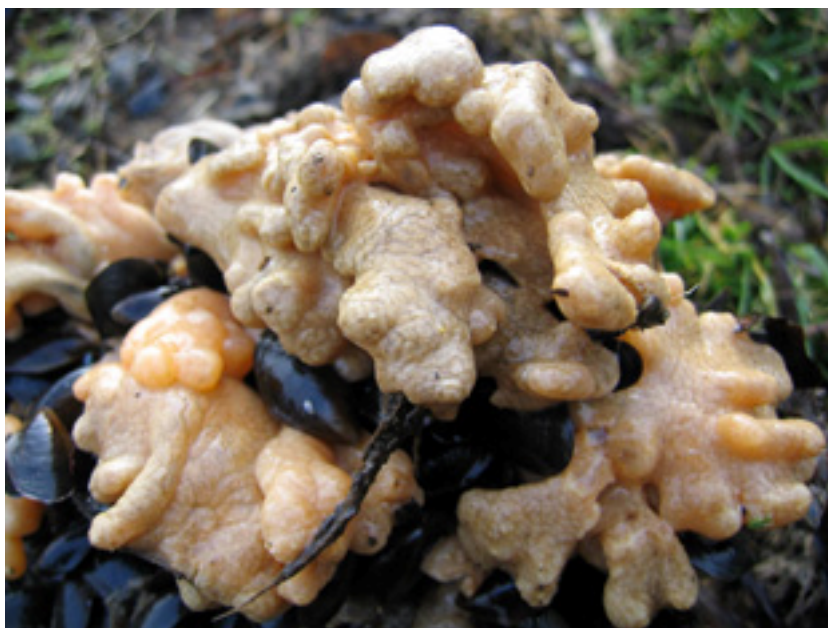
Рис. 1. Внешний вид колониальной асцидии Didemnum vexillum Kott, 2002 в обрастании установок для культивирования мидии в зал. Восток Японского моря.

колонии подобной формы имеют очень немногие виды дидемнид, одним из которых является Didemnum vexillum Kott, 2002 (рис. 1). В колониях также были найдены личинки; их строение соответствует строению личинок названного вида. Этот вид в последние годы известен как инвазионный вид на мидиевых и устричных плантациях в разных районах Мирового океана. История его изучения весьма интересна. Впервые большая вспышка численности и рост биомассы колониальной дидемниды, предварительно определённой как D. lutarium , были зафиксированы в августе 2000 г. в Массачусетсе [см. Lambert, 2009]. Затем, в 2001 г. подобная вспышка тогда ещё неизвестной дидемниды была зафиксирована в Новой Зеландии, в гавани Whangamata. Внезапность появления, скорость роста и размеры колоний, которые быстро обрастали доступный субстрат, были настолько впечатляющими, что вид получил английское название Whangamata Monster. С самого начала было сделано предположение, что вид является вселенцем в Новую Зеландию. В 2002 г. он был формально описан Kott [2002] как новый под названием Didemnum vexillum . Kott [2002] не считала этот вид